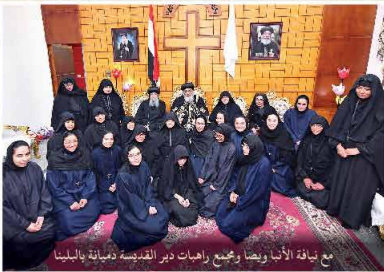
مع نيافة الأنبا ويصا ومجمع راهبات دير القديسة دميانة بالبلينا