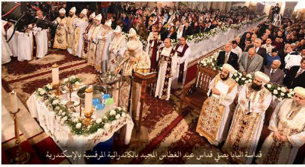
قداسة البابا يصلي قداس عيد الغطاس المجيد بالكاتدرائية المرقسية بالإسكندرية