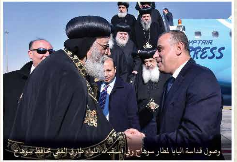
وصول قداسة البابا لمطار سوهاج وفي استقباله اللواء طارق الفقي محافظ سوهاج