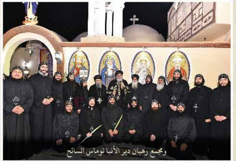
ومجمع رهبان دير الأنبا توماس السائح