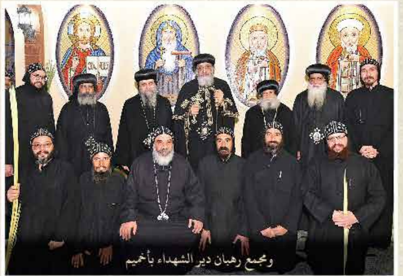
ومجمع رهبان دير الشهداء بأخميم