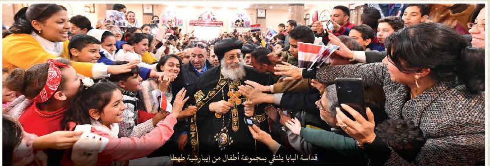
قداسة البابا يلتقي بمجموعة أطفال من ابارشية طهطا