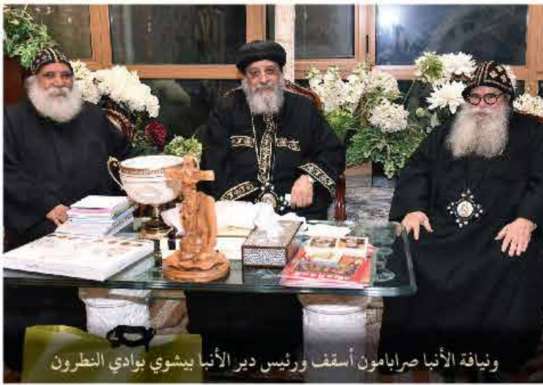
ويناية الأنبا صرابامون أسقف ورئيس دير الأنبا بيشوي بوادي النطرون