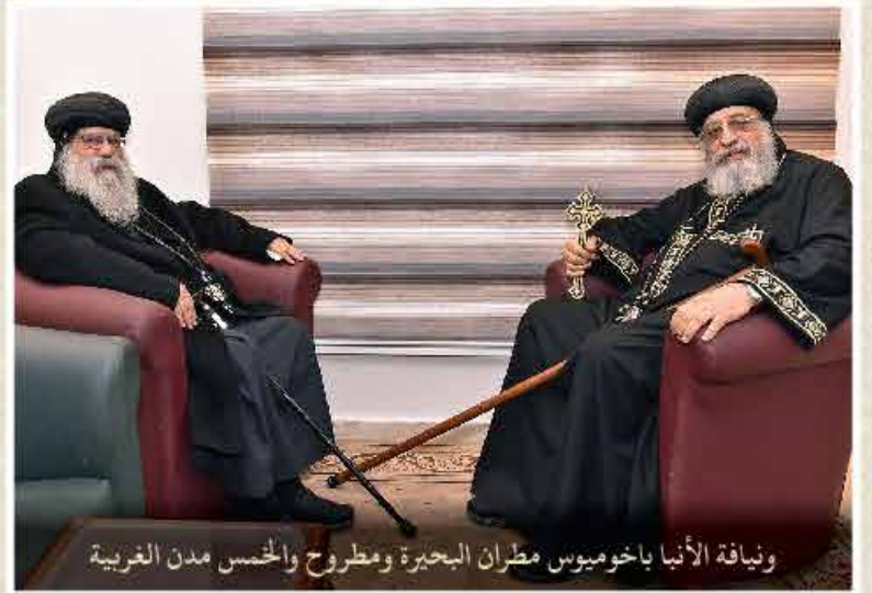
ويناية الأنبا باخوميوس مطران البحيرة ومطروح والخمس مدن الغربية