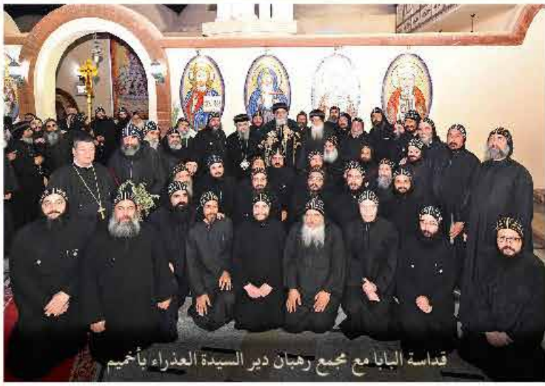
قداسة البابا مع مجمع رهبان دير السيدة العذراء بأخميم