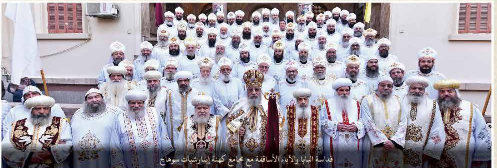
قداسة البابا والآباء الأساقفة مع مجمع كهنة إبيارشيات سوهاج