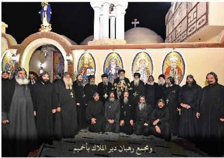
ومجمع رهبان دير الملك بأخميم