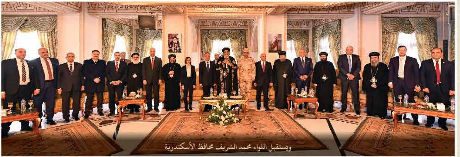
ويستقبل اللواء محمد الشريف محافظ الإسكندرية